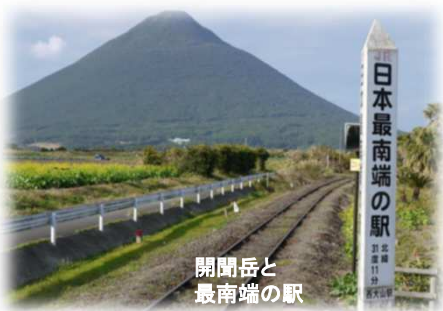
開聞岳と 最南端の駅